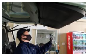
車内コーティング